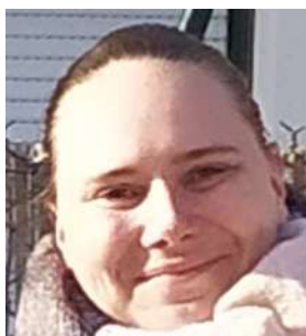
MAUCOTEL Marine Directrice Adjointe

Garant de la responsabilité communale et assurant l'interface avec les familles .