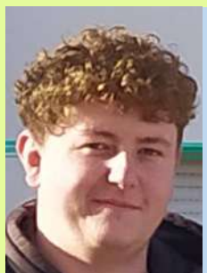
DIETERLING Joey Mercredis récréatifs ; Périscolaire et Vacances Scolaires