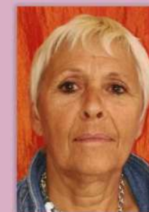
ROMO Marie Cuisine

Sans oublier les animateurs et animatrices saisonniers qui intègrent l'équipe pédagogique ponctuellement dans le cadre des vacances scolaires.