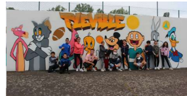
Graphie réalisé sur le mur du tennis

Malgré quelques ajustements de dernière minute, les huit semaines se sont succédées avec pour objectif de proposer des animations variées, ludiques et enrichissantes. Au programme : pique-nique, barbecue, veillée, sport, grand jeu, escape game, de nombreuses sorties (mini camp, parc d'attraction, fort aux énigmes, lac du Der...), sans oublier la semaine créative accompagnée d'un graphiste.