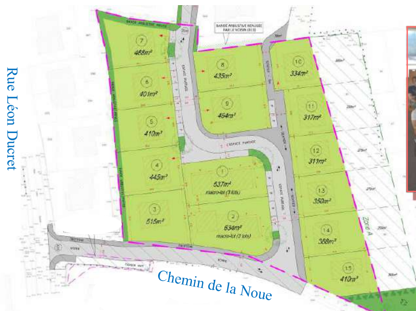
Esquisse non contractuelle du projet d'aménagement

Une réunion d'information à destination des riverains de l'opération portant sur l'aménagement d'un futur lotissement chemin de la Noue s'est déroulée le 17 juin dernier à la Salle des Fêtes. Les riverains concernés ont ainsi pu poser toutes leurs questions au lotisseur Solutions Habitats Nancy. L'opération prévoit 15 lots. Le permis d'aménagement devrait être déposé en mairie dans le courant du mois de juillet.