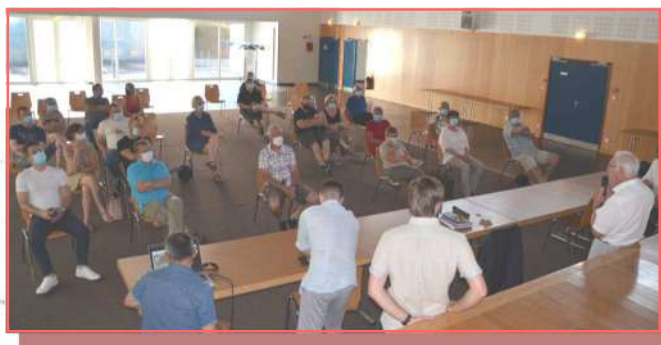
Réunion avec les riverains du projet

Une enquête publique est actuellement en cours jusqu'au 09 juillet 2021 dans le cadre du projet d'aliénation du sentier rural reliant le chemin de la Noue au chemin de la Févière.