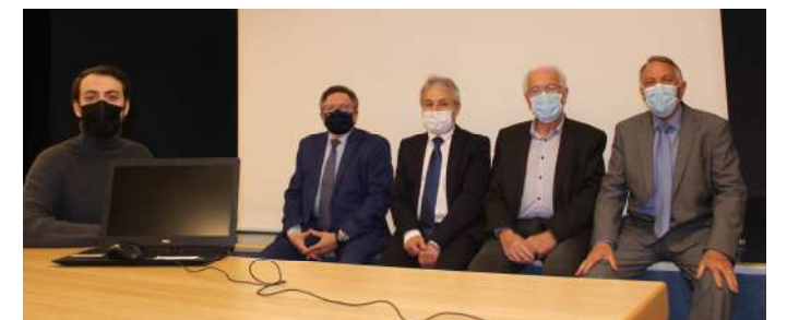
Un service mutualisé pour les communes de Fléville, Heillecourt, Houdemont et Ludres